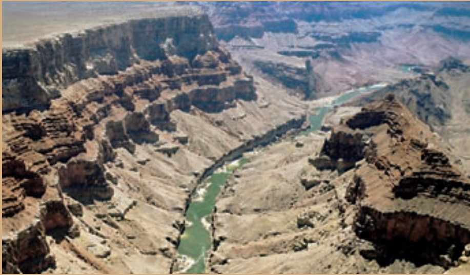
Van de in totaal 788 Werelderfgoederen in de wereld hebben er 154 betrekking op het natuurlijk erfgoed, waaronder de Grand Canyon.