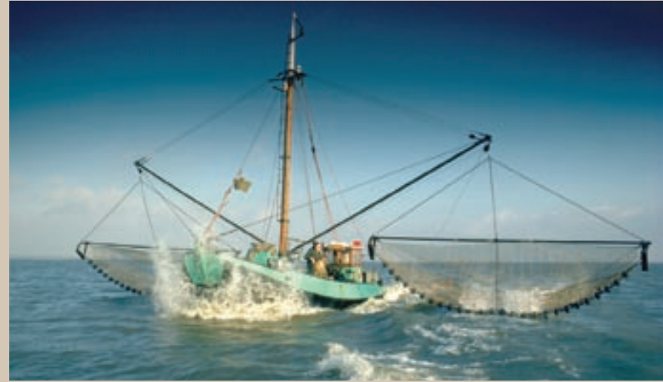
De Werelderfgoedstatus heeft nadrukkelijk oog voor de mensen en de activiteiten, die in het gebied plaatsvinden.