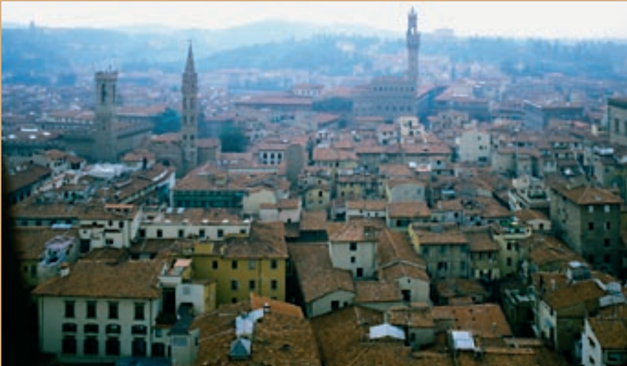
Florence geldt als een van de belangrijkste cultuursteden van Europa.