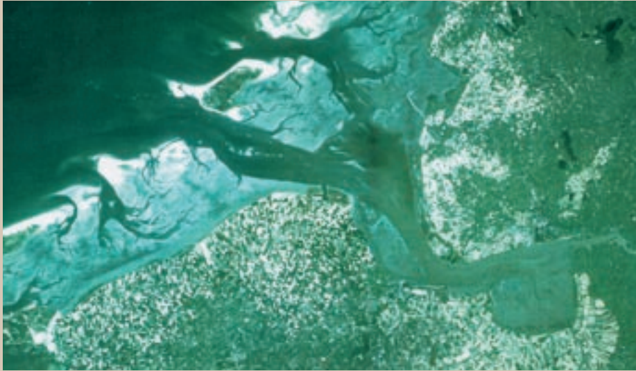
Plaatsing op de Werelderfgoedlijst ondersteunt het instandhouden van de specifieke identiteit van de Waddenzee.