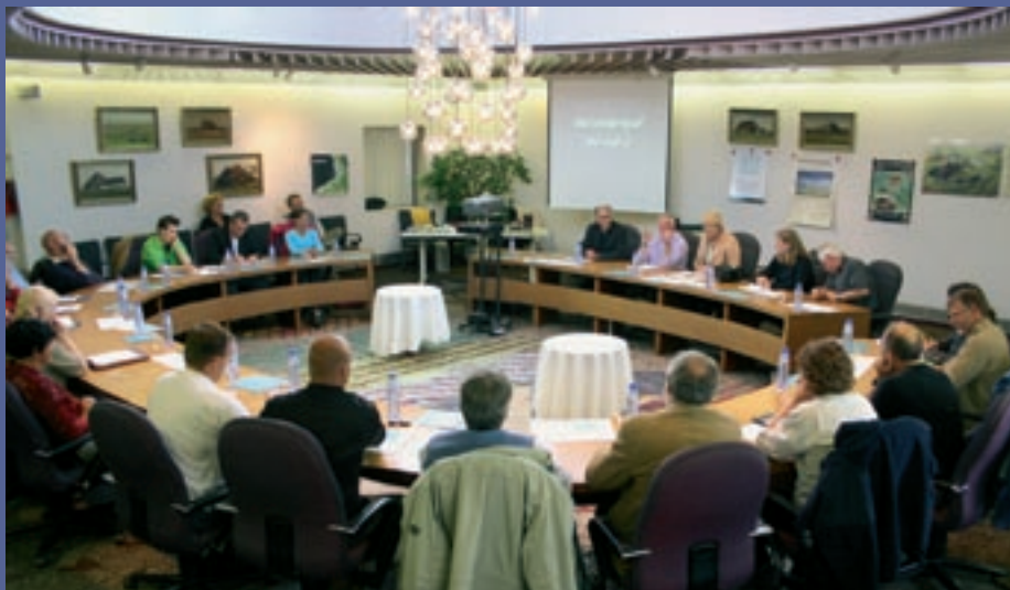
Informatiebijeenkomst in het gemeentehuis van Texel.