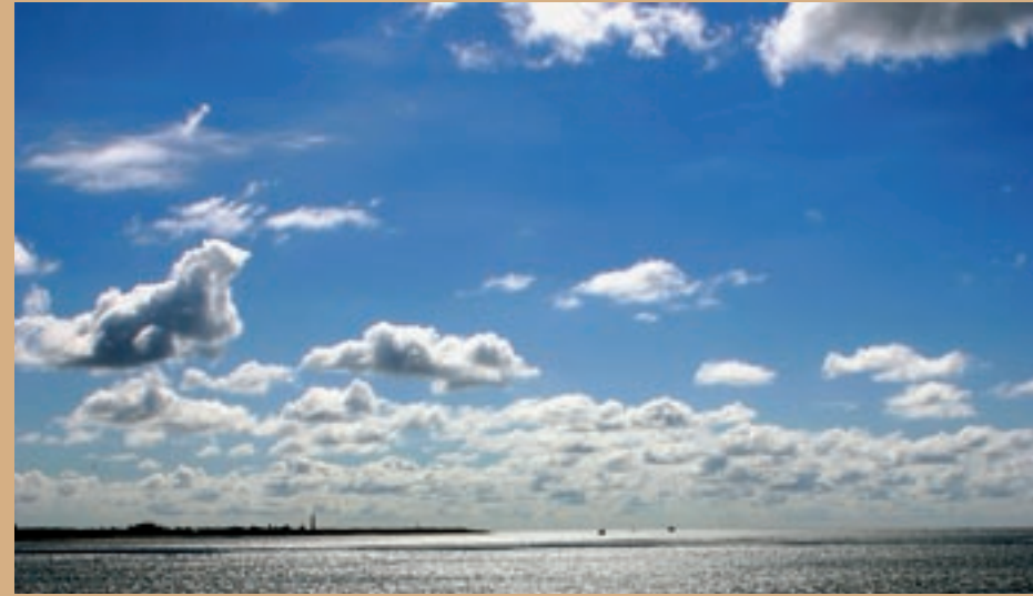
In Nederland heeft UNESCO tot nu toe zes Werelderfgoederen aangewezen; de Waddenzee zou nummer zeven kunnen worden.