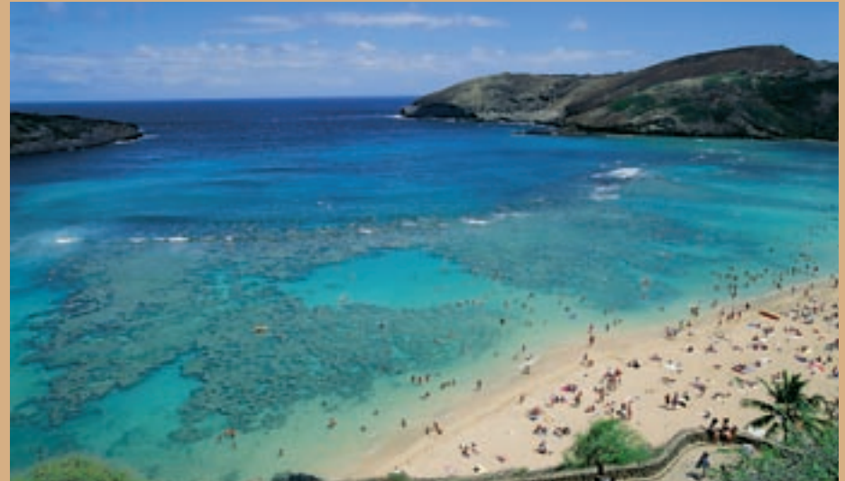
The Great Barrier Reef in Australië is een voorbeeld van een uniek en beschermd zeegebied, waar wonen, werken en recreëren samengaan.