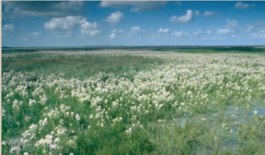
De Waddenzee is het grootste en belangrijkste kust-getijdewetland van Europa.