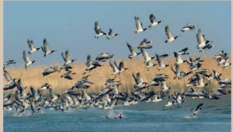
Naar schatting tien miljoen vogels maken jaarlijks gebruik van de Waddenzee.