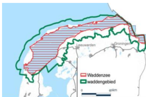
Figuur 2: Begrenzing Waddenzee en Waddengebied.

De Basismonitoring levert informatie op de schaal van het Waddengebied voor de verplichte monitoring uit EU-regelgeving Kaderrichtlijn Water (KRW) en Natura 2000(N2000), trilaterale verplichtingen voor het Trilateral Monitoring and Assessment Programme (TMAP) en daarnaast ook voor Nationale Omgevingsvisie (Novi) en Investeringskader Waddengebied.