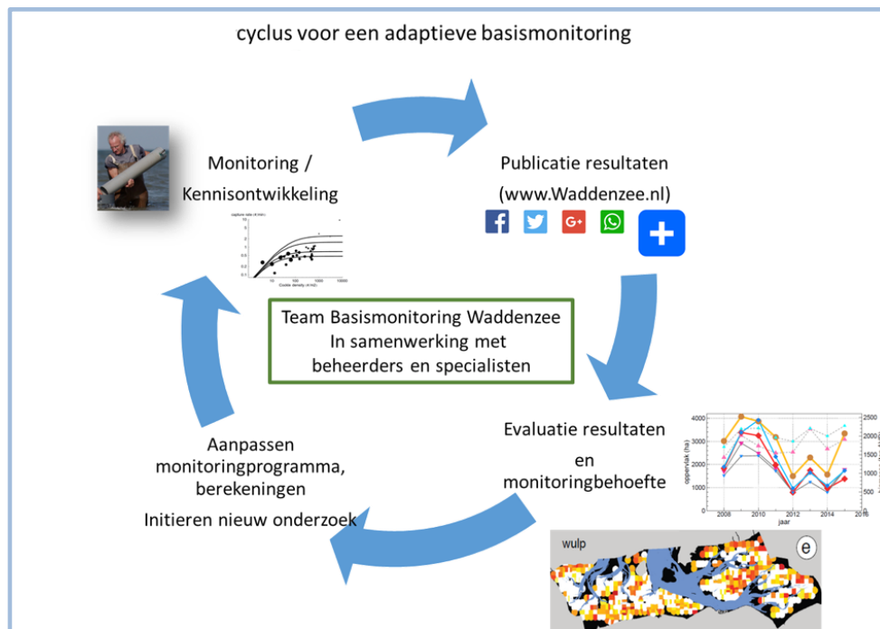
Figuur 4: Schematische weergave van de adaptieve monitoringcyclus

DE BASISMONITORING ONTWIKKELT ZICH STEEDS VERDER EN PAST ZICH AAN ALS DAT NODIG IS. DE BASISMONITORING WERKT VANUIT DE CYCLUS VOOR EEN ADAPTIEVE BASISMONITORING.