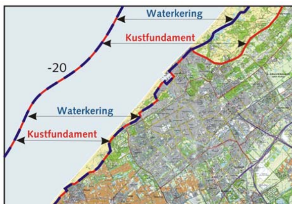
Figuur 2: Breed en smal kustfundament

In de grote wateren van Friesland, Noord-Holland, Zeeland en Zuid-Holland wordt de grens van het toepassingsgebied van de beleidslijn in de dwarsrichting, dus aan de 'oostkant' gevormd door het toepassingsgebied van de Beleidslijn grote rivieren en Beleidslijn meren en delta (in ontwikkeling). De Beleidslijn kust wordt uitgebracht onafhankelijk van het tijdpad en de uiteindelijke vormgeving en reikwijdte van de Beleidslijn meren en delta. De Toelichting licht deze grenzen toe.