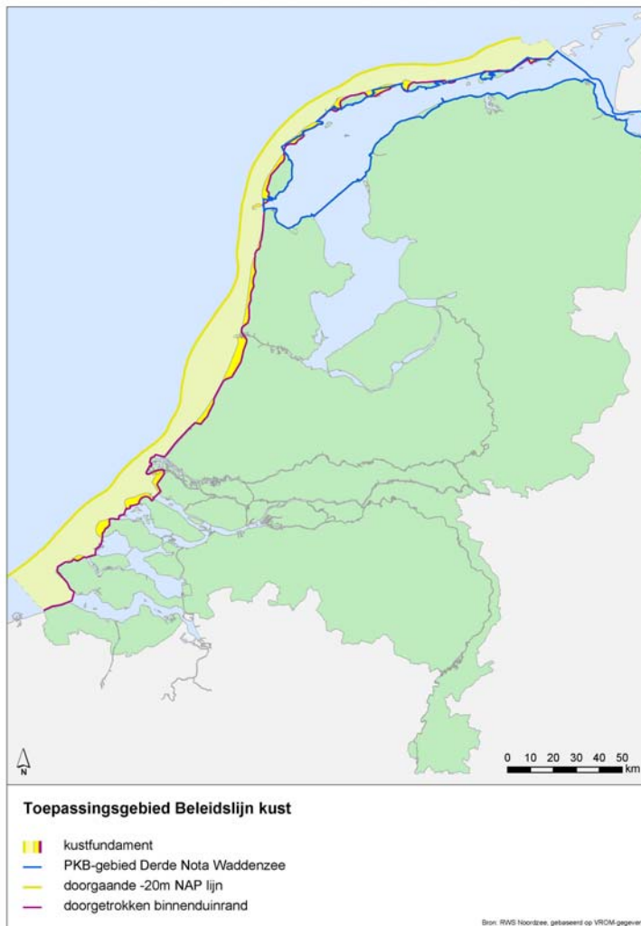
Figuur 1: Toepassingsgebied Beleidslijn kust - schematisch.

Deze beleidslijn is van toepassing in het kustfundament en de primaire waterkeringen van de Waddenzee en de Eems-Dollard (zie figuur 1).