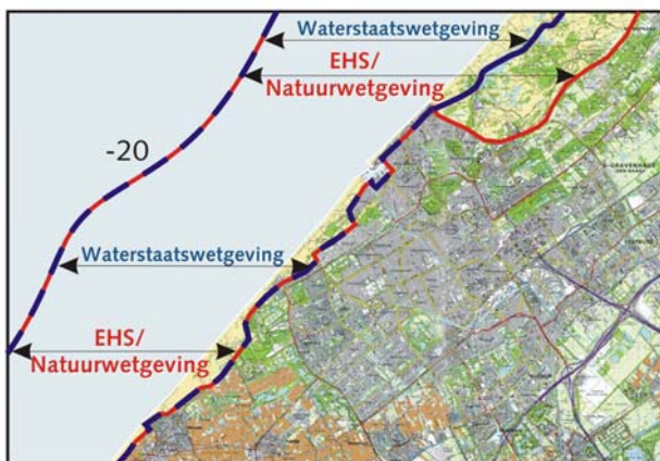
Figuur 3: Zones in het kustfundament en toepassing van waterstaats- en EHS/natuurwetgeving. Deze zones zijn van belang voor alle onderdelen in de handreiking uit paragraaf 6 (I, II, III en IV).

In de Beleidslijn kust zijn 3 toetsingskaders en toestemmingsvereisten relevant voor de beoordeling van ingrepen of activiteiten met ruimtebeslag: ruimtelijke ordening, waterveiligheid en natuur. De beleidslijn gaat uit van het bestaande onderscheid in de verschillende gebieden van het kustfundament: de grenzen van bestaand bebouwd gebied, de waterkering, de zeewaartse en landwaartse begrenzing. Het beleid voor die gebieden verschilt, net als de wettelijke kaders die van toepassing zijn. Zie figuur 3.